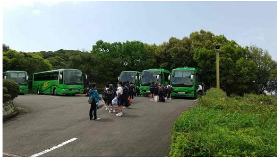
南知多ビーチランドへ向けて出発しました。