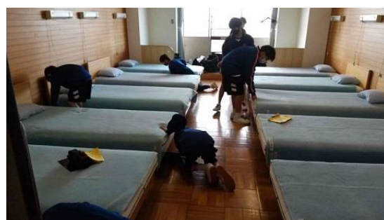
退所前の清掃活動の様子