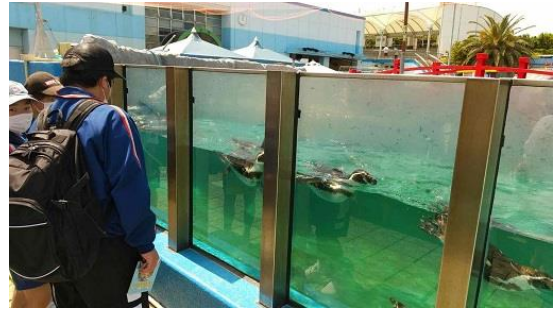
ビーチランドでの様子