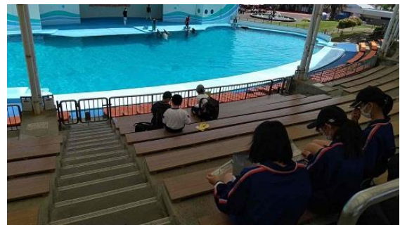
少し早めの昼食の時間です。