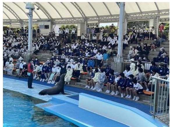
アシカのショーの様子

掲載については、以上とさせていただきます。イルカのショーが終わると、学校へ向けて出発することになります。お迎えをよろしくお願いいたします。