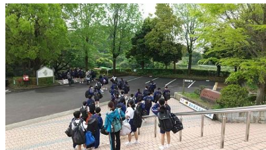
施設に別れを告げ、バスへ向かいます。