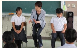
【ゲストティーチャーによるマナー講座】