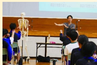
【心も体も健康にする健康教室】