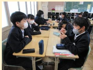
【自己存在感を高め、他者理解を深めるふれあいタイム】