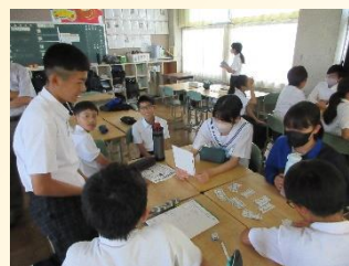
【安心して生活できる学級づくり】