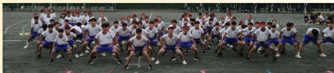
【絆を深める学校祭】