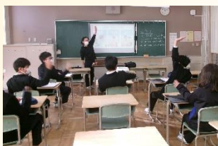
【地域の方による職業講話】