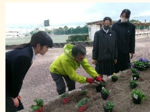
【地域の方と環境美化活動】