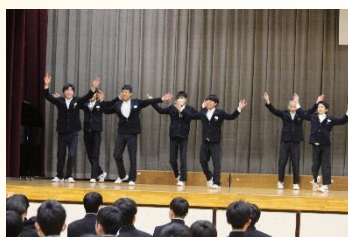
【感謝の気持ちを伝える卒業生を送る会】