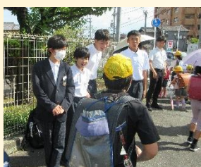
【生徒会あいさつ運動】