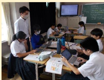
【見通しをもって取り組む授業】