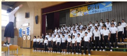
【心を一つに…合唱コンクール】