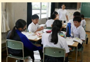
【仲間と議論し合う道徳】