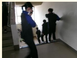
【自分の身は自分で守る安全教育】