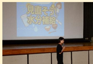
【ゲストティーチャーによる熱中症予防講座】