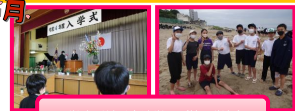
入学式/美浜宿泊学習(第1学年)