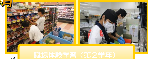
職場体験学習(第2学年)