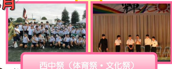
西中祭(体育祭・文化祭)