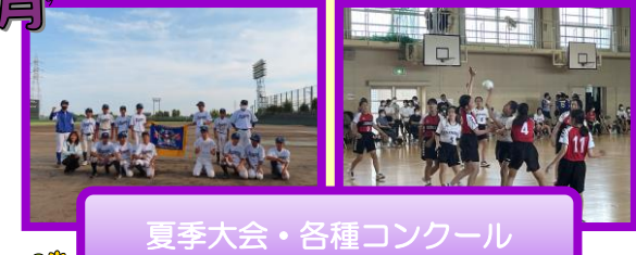
夏季大会・各種コンクール