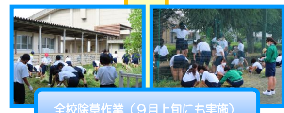
全校除草作業(9月上旬にも実施)