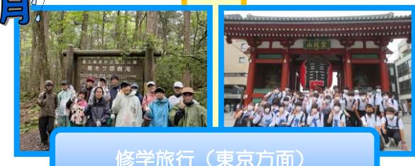
修学旅行(東京方面)