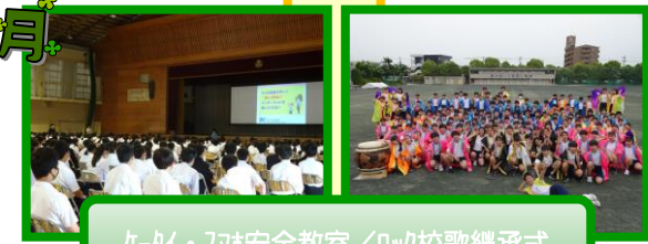
ケ-ケイ・入林安全教室/ロック校歌継承式