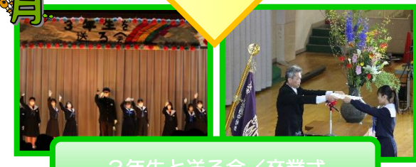
3年生と送る会/卒業式