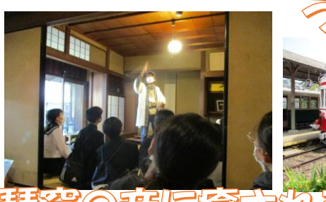
うだつの上がる町並みを仲間と見学!