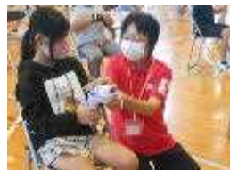
ハンカチを使って

学校保健委員会を5・6年児童とPTA保健安全委員の方の参加で開催しました。始めに保健委員会の児童が、けがが多い本校の実態と予防の必要性について報告をしました。その後、赤十字救急法指導員の方から、ハンカチやビニル袋を使ったけがをしたときの救急措置を教えてくださいました。けがをしないように気をつけようとする意識が高まりました。