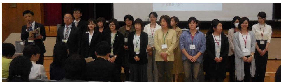
【平成30年度理事の皆様 お疲れ様でした】

子どもたちが、伸び伸びと成長し発達できることを目的として、会員の皆様がよりPTA活動に興味をもっていただけるよう、皆様のご協力をいただきながら、精一杯努力する所存でございます。至らぬ点があるかとは思いますが、今年1年間、よろしくお願いいたします。