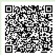
「ラーケーションの日」 ポータルサイト

「ラーケーションの日」には、様々な活動ができます。どのような活動ができるのか、どうやって「ラーケーションの日」を取ればよいのかなど、興味をもった人は、おうちの方に配った「保護者用リーフレット」を見たり、右の二次元コードから、「ラーケーションポータルサイト」を見たりしながら、おうちの方と話し合ってください。