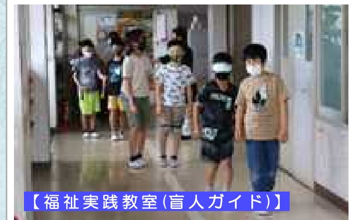
【福祉実践教室(盲人ガイド)】