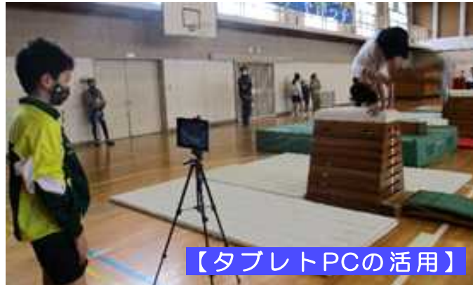
【タブレットPCの活用】