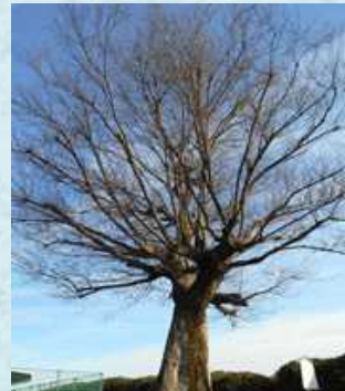
【市指定天然記念物】