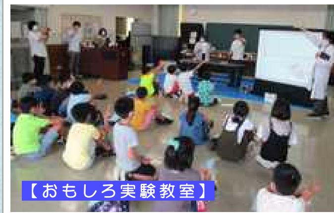
【おもしろ実験教室】