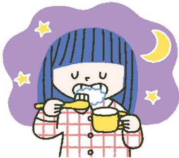
みがくタイミング

寝る前の歯磨きは特に丁寧に磨きましょう。寝ている間におむし歯になってしまうかも・・・。