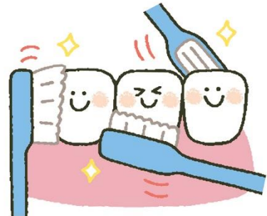
じょうずなみがき方

毛先が広がった歯ブラシでは、歯をうまく磨けません。お家の人に伝えて新しい歯ブラシを用意してもらおう。