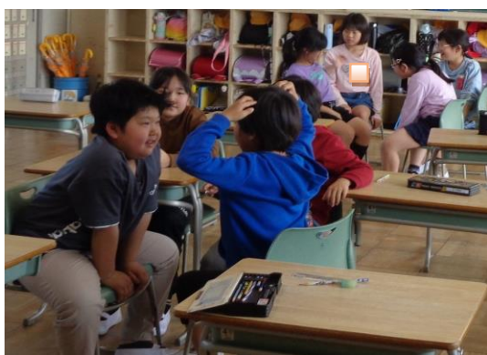
〔学級目標を決める時の話し合いの様子〕 (グループ)

4年生に進級して、1か月が過ぎようとしています。委員会活動が始まり、それぞれの委員会の仕事や当番活動に、責任感をもって取り組んでいます。この学校をよりよくしようとがんばる姿に、頼もしさを感じます。5月は、「なかよし学級」の活動がスタートします。4年生として、上級生の手助けをしたり、下級生に優しくしたりして、新しい仲間と一緒に、楽しい時間を過ごせるとよいと思います。授業の話し合い活動では、ペアやグループで様々な意見を出し合い、考えを深める様子が見られます。これからも自分と友達の意見を比較し、違いを認め合って、新しい発見をしていってほしいと思います。