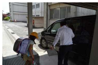
【引き渡し下校訓練】