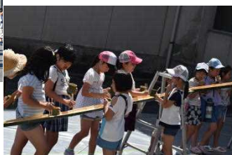
【おやじの会 流しそうめん】