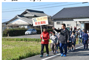
【体振丸甲ウォーキング大会】