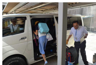
【引き渡し下校訓練】