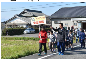
【体振丸甲ウォーキング大会】