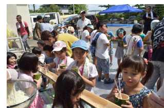
【おやじの会 流しそうめん】