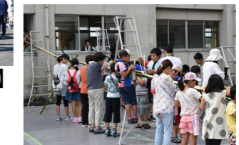
【おやじの会 流しそうめん】