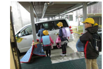
【引き渡し下校訓練】