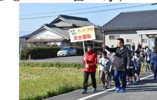
【体振丸甲ウォーキング大会】