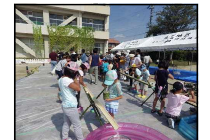
【おやじの会 流しそうめん】