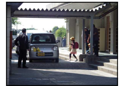
【緊急時引き渡し下校訓練】