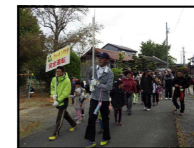
【体育振興会丸甲支部 丸甲ウォーキング大会】