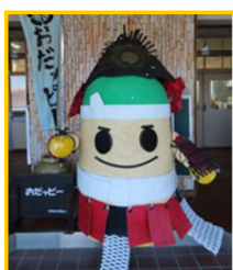
三宅小マスコット おだっぴー

明治5年の創立以来、地域とともに教育環境を整えながら発展してきました。長年にわたり多くの表彰や研究委嘱を受け、特色ある教育活動を積み重ねてきました。本年度は、稲沢市より「魅力ある学校・学級づくり推進事業」の研究委嘱を受け、未来を見据えたよりよい学校づくりを続けています。