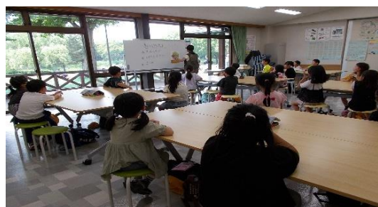
②春の校外学習(カスタネット作りの説明を聞く様子)