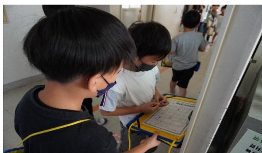
①学校探検(1年生のシール貼りを手伝う2年生)

春の校外学習では、アクアトト・ぎふに行きました。ここでも、1年生との交流ができ、楽しい校外学習となりました。