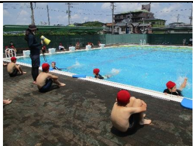
間隔をあけて行われる水泳授業