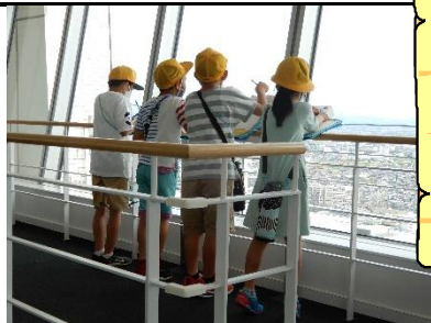
「三菱エレベーター」の見学へ