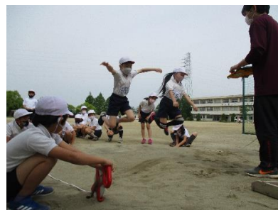
1年ぶりの「体力テスト」

本年度、小正小学校では、校訓「考える 心やさしい 丈夫な子」を合言葉に、教師と児童との心のふれあいを基盤にして教育活動を展開していきます。そして、一人一人のよさを伸ばし、自分の思いを伝えられる児童の育成を目指して取り組んでいきます。本年度もよろしくお願いいたします。