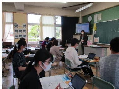
教職員「タブレット研修」

多様な子どもたちを誰一人取り残すことなく、「個別最適な学び」と「協働的な学び」を充実していくことをめざし、本年度、高速大容量の通信ネットワークが整備され、1人1台のタブレット PC が配付されました。