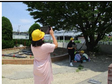
5年「タブレット PC で俳句作り」