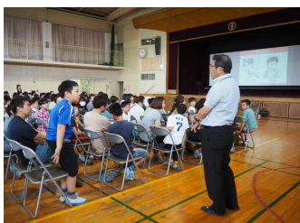
【6年生・情報モラル教室】