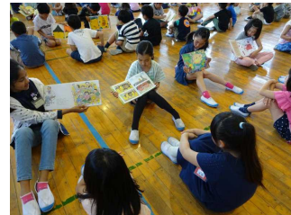
【2・5年生ふれあい読み聞かせ】