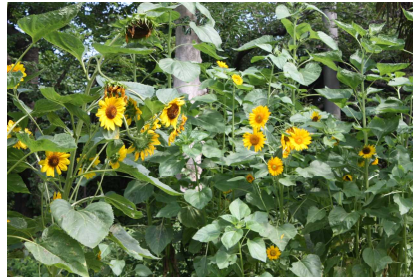
【地域の方からいただいたひまわりの苗が成長して、今、こんなに花が咲きました】