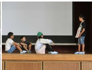
【生活委員会・きらきらあいさつチャレンジ】