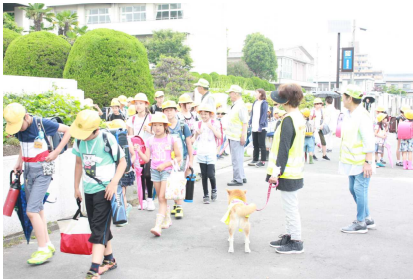
【登下校の児童の見守り支援活動】

1学期間、多くの地域の方、近隣企業の方に大変お世話になりました。子どもたちが健やかに成長できるのは、地域みなさんの温かい眼差しやお声かけによるものがとても大きいと感じています。子どもたちがその思いに感謝して、さらに成長していけるように努めていきます。