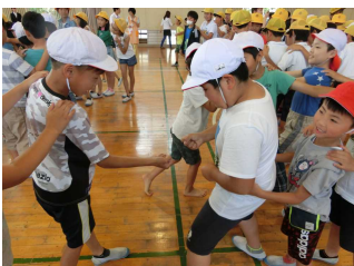
【ふれあい遊び(じゃんけんジェンカ)】