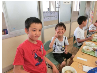
【異学年でふれあい給食】