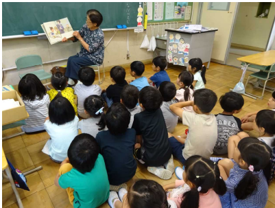
【きらら会の読み聞かせ活動】