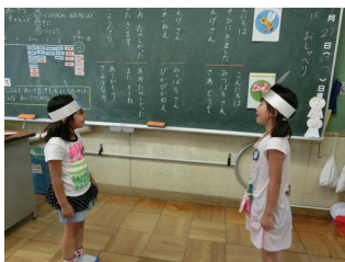
【道德の授業・役割演技】

個性を伸ばし、思いやりの心を育むことに重点をおき、道德の授業に力を入れています。また、異学年が交流する様々なふれあい活動を行い、よりよい人間関係づくりと相手の立場を考えて行動する児童の育成を目指しています。