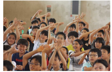
【地域の方から講師をお招きして、児童学校保健委員会を開催し、体を動かす楽しさを教えていただきました】