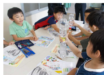
【4年生・下水道のしくみ出前授業】