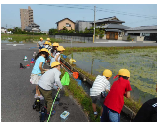
【2年生・生きものさがし】