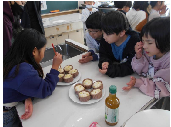
『感謝の会』の様子です。