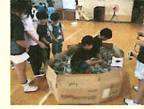
千代田フェスティバル